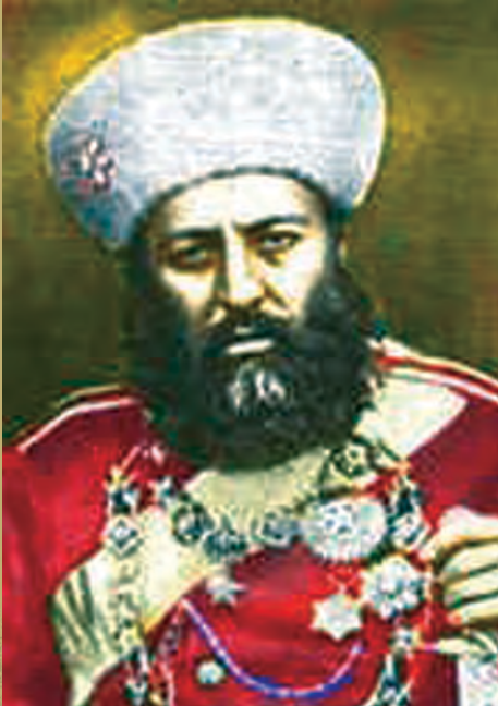
امير عبدالرحمن خان

د سردار عبدالرحمن خان رامينځ ته کيدل، د ملوک الطوايفی له منځه وړل، اسلام ته د نورستان د خلکو رابلل، د پنجدي نيول، له افغانستان څخه د انگليسانو تلفات او وتل دا هغه مفاهيم دي چې په دې لوست کې به ور سره اشنا شئ.