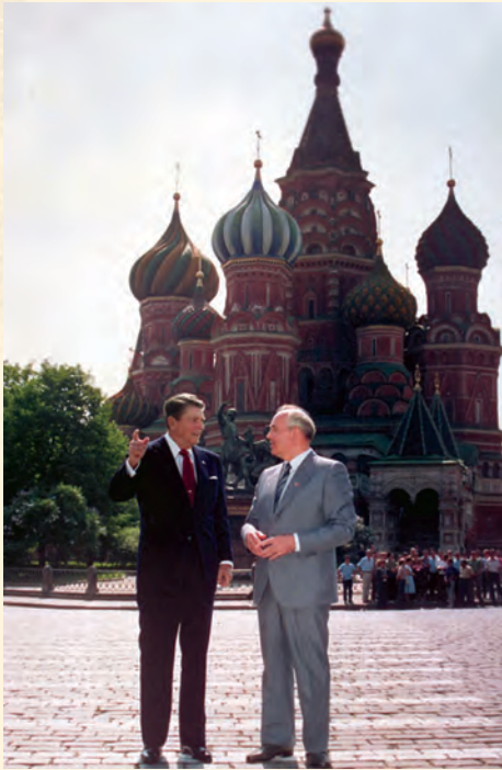
ریګن او ګورباچوف

هېواد واکمن کړی و، له شدید کنترول او د ډول ډول ټکولو او اختناق سره سره، په پای کې د میلیتونو د اعتراضاتو په وړاندې چې کلونه کلونه یې د مرکزي حکومت د واکمنۍ لاندې ژوند تېر کړی و، ټینګار ونه شو کړای او هغه پراخ ټولنیز بدلونونه، په ځانګړې توګه هغه زاړه فردي روشونه او وېشنه چې ټولنه ترې جوړه شوې وه او د کمونېست ګوند منشي تطبیقوله، د ۱۹۸۰ز د لسیزې بدلونونه یې چټک کړل، چې په پای کې د میلیتونو د زندان ور پرانیستل شو.