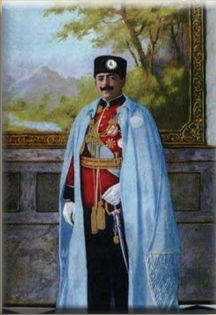
شاه امان الله غازي

د امان الله خان شخصیت، واک ته د رسیدو څرنگوالی، د خپلواکۍ په تر لاسه کولو کې د هغه ونډه او هغه تړونونه چې له انگریزانو سره لاسلیک شول چې د هغه له امله د افغانستان خپلواکي په رسمیت وپېژندل شوه په دې لوست کې به ورسره آشنا شی.