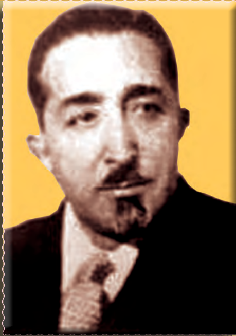
سردار محمد هاشم خان

د اصولنامو ضرورت د هغوی ترتیب او تدوین، اقتصادي کړکېچونو او د هغه له منځه وړل هغه مطالب دی چې په دې لوست کې به ورسره آشنا شئ.