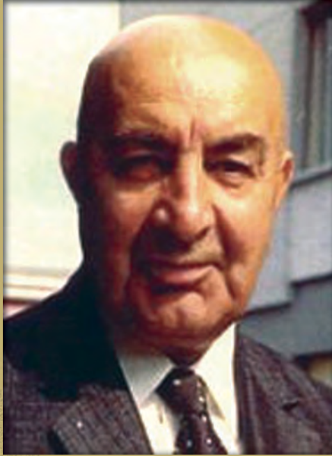
سردار محمد داؤد خان

د لومړني پنځه کلن پلان ضرورت، د سردار محمد داود خان ونډه د دې پلان په تکميل او پلي کولو کې، دا هغه مفاهيم دي چې په دې لوست کې به يې ولولئ.