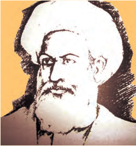
محمد جان خان وردک

د مجاهدینو او مبارزینو مشرانو لکه محمد جان خان وردک، ملا دین محمد مشک عالم، صاحب جان تره کې، سردار محمد ایوب خان او محمد عثمان خان صافی په نورو سیمو کې د انگلیسانو پر ضد یرغلو نه پیل کړل. د دغو مشهورو جگړو څخه یوه هم په کندهار