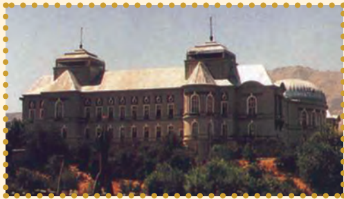
د دارالامان ماڼۍ

امان الله خان انگلیسانو ته د افغانستان د خپلواکۍ خبر ورکړ، دا چې د برتانیې دولت دې ته حاضر نه و، چې له خپل استعماري نفوذ څخه تېر شي او د افغانستان خپلواکي په رسمیت وپېژني، په ځواب کې یې یوازې د پلار د مړینې تسلیت ور ولېږه او د خپلواکۍ هیڅ یادونه یې ونه کړه.