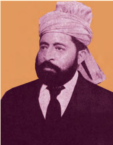
سردار محمد ایوب خان

جوخت له نارینه وو سره سمه ونډه اخستلې ده. څرنګه چې د ځوانې ملالې مشهوره حماسه چې د میوند په جگړه کې د پام وړ ګډون در لود، کله چې د جگړې په ډګر کې افغان بیرغ لرونکی په شهادت ورسید ملي بیرغ یې په لاس کې ونیو او نه یې پرېښوده چې د غازیانو روحیه ضعیفه شي او دا لنډې یې په اوچت غږ د جگړې په ډګر کې وویل. چې د غازیانو جنګي روحيې یې پیاوړې کړې، جگړې شدت وموند او مجاهدین بریالي شول.