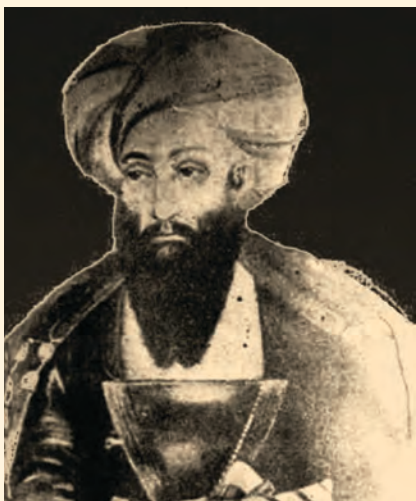
سردار محمد اعظم خان

د امير محمد افضل خان تر مرگ وروسته سردار محمد اعظم خان د عبدالرحمن خان په موافقه سلطنت ته ورسېد. امير محمد اعظم خان يو نوښتگر سړی و، غوښتل يې چې يو شمېر اصلاحات په افغانستان کې رامنځ ته کړي، خو وخت ورته پيدا نه شو. امير شېر علي خان له هراته کندهار ته ورسېد او د کندهار خلک چې د امير محمد اعظم خان د زامنو د ظلم له لاسه ډېر تنگ شوي وو، نو د امير شېر علي خان هر کلي يې وکړ. په دې وخت کې امير عبدالرحمن خان د شمالي ولايتونو په ايلولو بوخت و. امير شېر علي خان د کابل