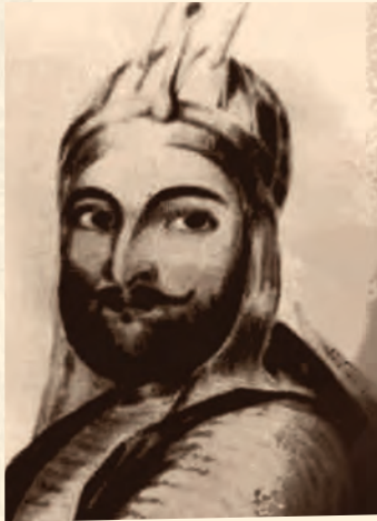
وزير اکبر خان

امير دوست محمد خان له بخارا څخه راووت او د جگړې د تياري لپاره له تاشقرغان څخه کوهستان ته لاړ. د کوهستان خلکو د مير مسجدي خان په مشرۍ پر انگليسانو يرغل کړی وه. د يوشمېر ځاينينو د خيانت له امله نوموړی يرغل خنثی شو، نو ځکه امير دوست محمد خان کابل ته راغی او ځان يې مکناتېن ته تسليم کړ او مکناتېن دا ټينگار وکړ، چې د شاه شجاع د وزير په توگه