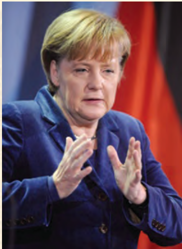
انگلا مرکل د آلمان لومړۍ وزیره

د دولت اجرایی قدرت د فدرالی صدراعظم سره وي. بوند سرات (فدرال شورا) صدراعظم ټاکي. جمهور رئیس د یو گډې ناستې د بوندسرات او د ایالتی استازو (بوند ستاگ) د مساوي غړو په گډون د پنځو کالو لپاره ټاکل کېږي. سره له دې چې په ۱۹۹۰ز کال کې برلین پلازمېنه وټاکل