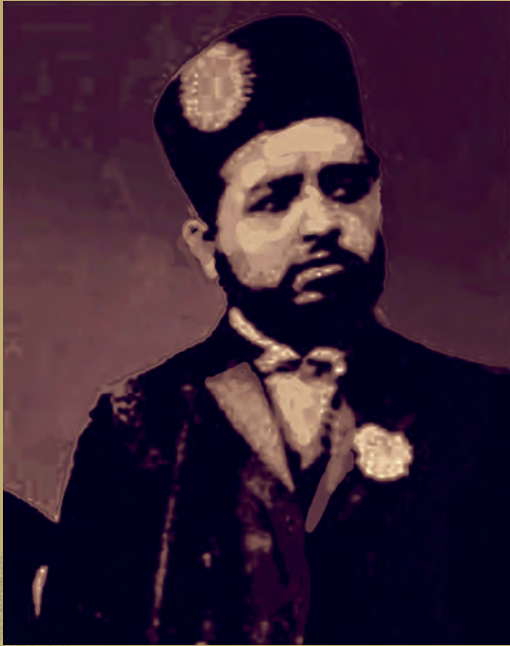
امير حبيب الله خان

د امير حبيب الله خان واک ته د رسيدو، د نوموړي د حکومت مهمې کړنې او د هغه د قتل لاملونه هغه مطالب دي چې په دې لوست کې به ورسره آشنا شئ.