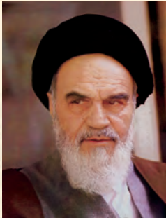
آیت الله سید روح الله خمینی

بښځو د انتخاب حق، د لویو سرکونو جوړول، د سیاسي گوندونو رامنځ ته کول، د موټر جوړولو کارخانې، دارو گاو نوې پټلۍ، د ایران او روس تر منځ د گاز د نل لیکي غزول، د نړۍ له هېوادونو سره د سیاسي اړیکو ټینګول، د نفتي فابریکو جوړول، له عراق سره د اوبو د سرحدونو ټاکل، د فرانسې او آلمان په مرسته د هستوي انرژۍ د مرکز جوړول هغه څه دي چې یادولی یې شو.