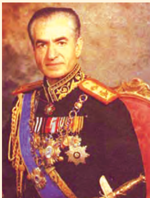
محمد رضا شاه پهلوي

محمد رضا شاه پهلوي د رضا شاه پهلوي زوی او د پهلوي کورنۍ دويم پاچا و. هغه د ۱۲۹۸ لمریز کال د عقرب په مياشت کې په تهران کې زېږېدلی، لومړنۍ زده کړې يې په پوځي ښوونځي کې او لوړې زده کړې په سویس کې بشپړې کړې. د ۱۳۲۰ لمریز کال د وري (سنبلي) په