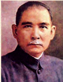
سون يات سن

د عباسي اميرانو پر وخت، په ځانگړې توگه هغه وخت چې د خلافت مرکز له دمشق څخه بغداد ته يو وړل شو، د اتمې زېږديزې پېړۍ په نيمايي کې، د تزيني شيانو د غوښتنې له کبله ددې اړتيا پيدا شوه چې د سيمې د هېوادونو په سوداگرۍ کې په ځانگړې توگه له چين سره د مرکزي آسيا د هېوادونو د ځمکې له لارې نوي والي راشي. خو د فارس خليج، د عربستان له جنوب، د افريقا له ختيځ، هند، د آسيا له جنوب ختيځ تر چين پورې د اوبو له لارې راکړه ورکړه د ډېر اهميت څخه برخمنه وه. په دې دوره کې يو قوي مرکزي دولت پراسلامي نړۍ حکومت کاوه او له چين سره د پراخو سوداگريزو اړيکو مدافع و. په چين کې هم د تانگ سلسله د سوداگريزې لارې د امنيت ضمانت کړی و.