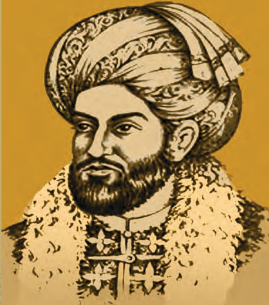
احمد شاه بابا

د احمد شاه بابا واک ته د رسيدو خرنگوالی، د هغه ادارې نظام او مهمي کړنې په دې لوست کې تر بحث لاندې نيول شوې دي.