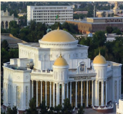
د ترکمنستان د پارلمان ودانۍ

څرنگه چې زیاترو ترکمنانو د تاریخ په اوږدو کې د څارویو