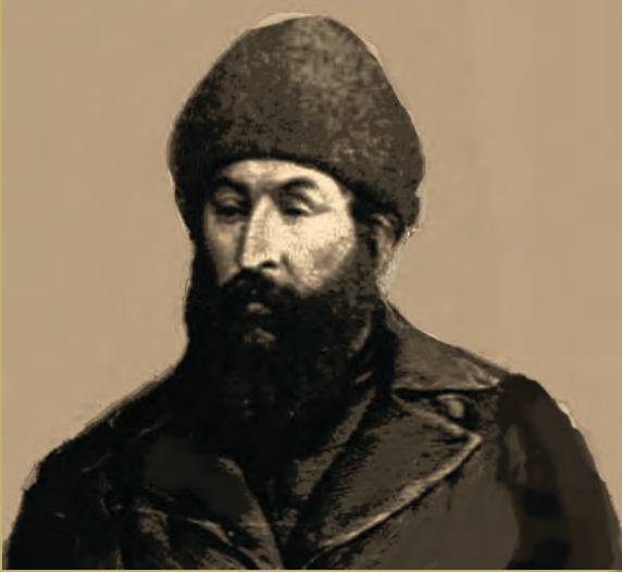
امير شير علي خان

سردار شير علي خان څرنگه واک ته ورسيد. د کومو مخالفونو سره مخامخ شو او ادارې يې ولې سقوط وکړ. دا هغه مطالب دي چې په دې لوست کې به ورسره آشناشئ.