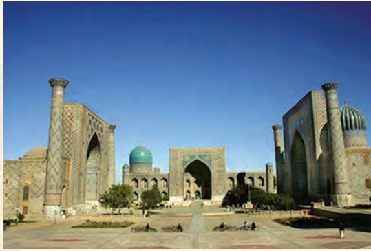
د طلا کاری جومات

عربانو د اوومې میلادي پېړۍ په دویمې نیمایي کې د مرکزي آسیا مهمې برخې ونیولې. قتیبه