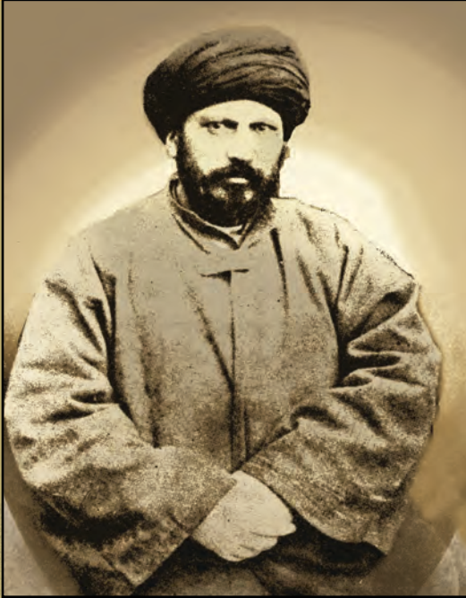
سید جمال الدین افغانی

په کومو برخو کې اصلاحات رامنځ ته شول، پایلې ئې څه وې او د انگلسانو د دویم تیري لاملونه او اړوندې موضوعگانې به په لاندې متن کې ولولئ.