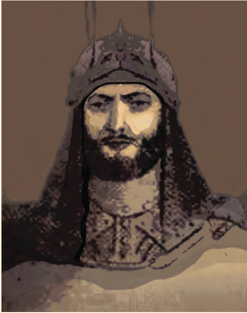
وزير فتح خان

روروز فيروز الدين حكمراني كوله او شاه محمود د خپلې دويمې پاچاهۍ له پيله ډېر وخت په پايتهخت