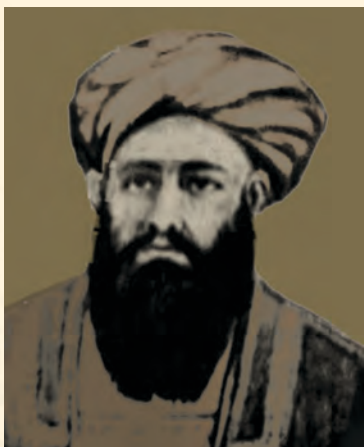
سردار محمد افضل خان

د امير شېر علي خان گوبڼه والی د دې سبب شو، چې سردار محمد اعظم خان او سردار عبدالرحمن خان کابل ونيسي، چې د کابل تر نيولو وروسته محمد افضل خان سلطنت ته ورسېد او څنگه چې انگليسان په هند کې د امير محمد افضل خان له پاچاهۍ خبر شول، نو سمدستي يې د هغه سلطنت به رسميت وپېژانده. وروسته يې خپل سياسي استازی کابل ته واستاوه، په داسې حال کې چې د افغانستان رسمي پاچا شتون درلود او خلکو يې ملاتړ کاوه.