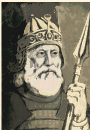
خوشحال خان خټک

د ۱۶ ز پېړۍ په نيمايي کې د خټکو قبيله په تدريجي توگه د واک خاونده شوه او په سهيل کې يې د نورو قبایلو ترمنځ مهم ځای تر لاسه کړ. په (۱۵۸۰) ميلادي کال کې جلال الدين محمد اکبر له اټک څخه تر پېښوره د سوداگريزې لارې د امنيت چارې د خټکو قبيلې ته وسپارلې او په بدل کې يې ورته له کاروانونو څخه د ماليې اخيستلو امتياز ورکړ، همدغه امتياز د خټکو او يوسفزو ترمنځ اختلاف رامنځ ته کړ. د شاه جهان د حکومت په وخت کې د خټکو د قوم مشري خوشحال خان ته ورکړل شوه، خوشحال خان د توري او سياست خاوند او هم غښتلي شاعر و. خوشحال خان له مغولي پاچاهانو سره په لومړيو کې نېکې اړيکې درلودې، خو وروسته يې اړيکې د مغولو له دربار سره خړې پرې شوې، اورنگزيب خوشحال خان ونيو او بندي يې کړ، څلور کاله وروسته له زندان څخه خوشې شو او بيرته يې د خوځښت مشري په غاړه واخستله، په ۱۶۷۸ - ۱۶۷۰ز کال کې ۴۰ زره مغولي پوځيان له افغانانو سره د تاترې په جگړه کې ووژل شول تر دې ماتې وروسته