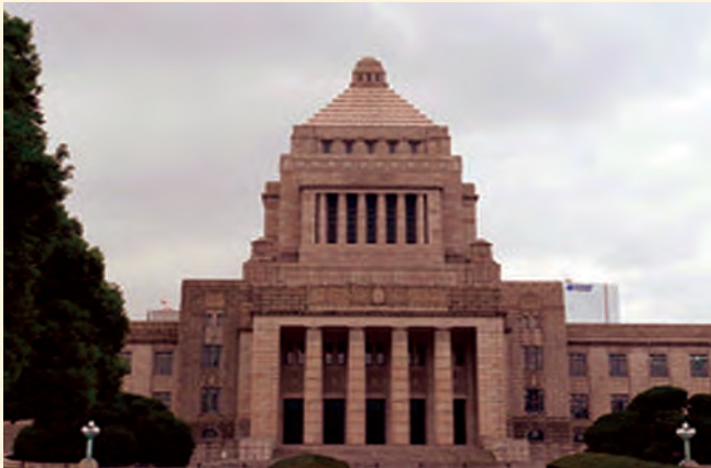
د جاپان د پارلمان ودانۍ

د جاپان هېواد له یو شمېر وړو او لویو ټاپوگانو څخه جوړ شوی دی او په لرې ختیځ کې پروت دی. سره له دې چې ځمکه یې لږه ده، د وګړو شمیرې یو ۱۴۰ میلیونو ته رسېږي. تر لومړۍ نړیوالې جگړې او د المان تر ماتې وروسته، جاپان د صنعتي او لوی ځواک کېدنې لپاره ډېرې هلې ځلې وکړې او له المان او اروپایي هېوادونو څخه د فني زده کړې په لړ کې په چټکۍ سره له اقتصادي او پوځي پلوه سیمه ییزه ځواک شو. هغه و، چې تر دویم نړیوال جنگ دمخه د تکنالوجیکي همکارۍ له امله له المان سره نږدې شو او د دویم نړیوالې جگړې په پیل کې له المان او ایټالې سره په (محور) دولتونو کې د متفقینو پر ضد شامل شو. په دویمې نړیوالې جگړې کې یې په پاسفیک (آرام) سمندر کې خپل ډېر متصرفات له لاسه ورکړل او د