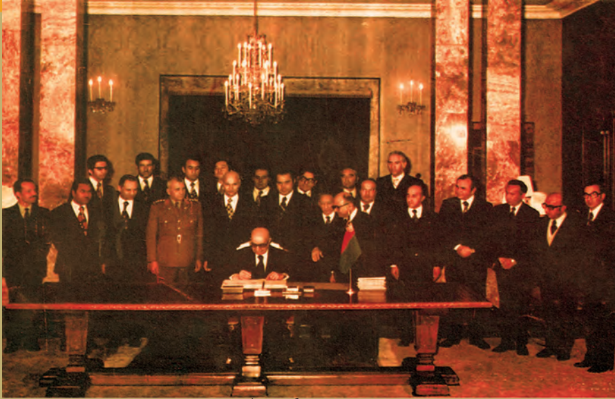
جمهور ریس محمد داود خان د کابینې له غړو سره

ولي سلطنت((مشروطه شاهي)) په جمهوریت بدله شوه، کومو شخصیتونو پکې لویه ونډه درلوده، له دې سره به آشنا شی.