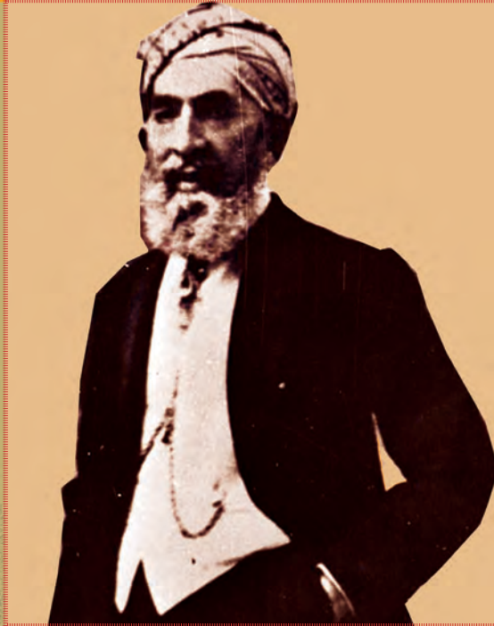
محمد يعقوب خان

شهزاده يعقوب خرنګه واک ته ورسيد. د گندمک تړون کومې پايلې درلودې، په د دي لوست کې به ور سره آشنا شئ.