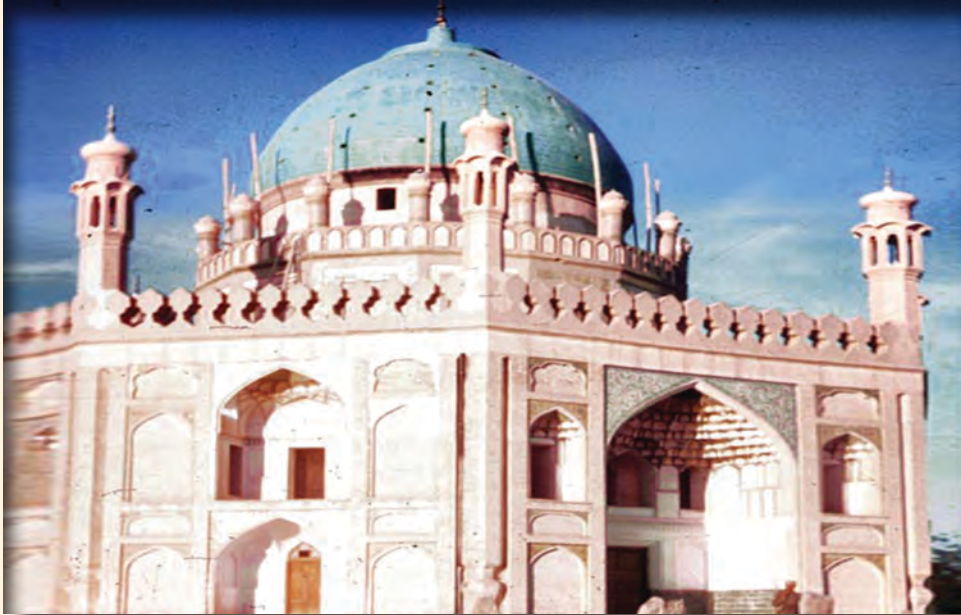
د احمد شاه بابا د وخت يوه ودانۍ

جوړولو لپاره د ملي وحدت رامنځ ته کول و. دويمه يې دا وه، د افغانستان طبيعي سرحدونه چې د آمو له سيند څخه د سند تر سينده پورې وو، تامين کړي او درېيمه موخه يې د گاونډيو هېوادونو پر وړاندې د دفاع ټاکل و. ددې لپاره چې داخلي اختلافات له منځه يوسي او په دولتي چارو کې له خلکو مشوره واخلي، د لومړي ځل لپاره يې يوه دايمي جرگه جوړه کړه، چې د شير سرخ د مزار د جرگې ځينې غړي يې په کې هم شامل کړل.