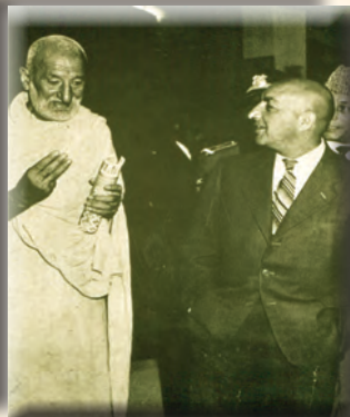
خان عبدالغفار افغانستان ته په سفر کې

جگړه اخته شول، هند کشمیر په دې بانه چې حاکم یې هندو دی، نیولی و، خو د مسلمانانو په دې دلیل، چې دېری او سپدونکې یې مسلمانان دي، باید کشمیر د پاکستان یوه برخه وي. د پاکستان اصلي ستونزه د ملي هويت جوړونه د سياسي پولو ټاکل د واقعیت پر بنسټ او باثباته او د منلو وړ رژیم د خلکو لپاره د توکمي، ژبني، عقیدتي او مذهبي توپیر په لرو سره ؤ.