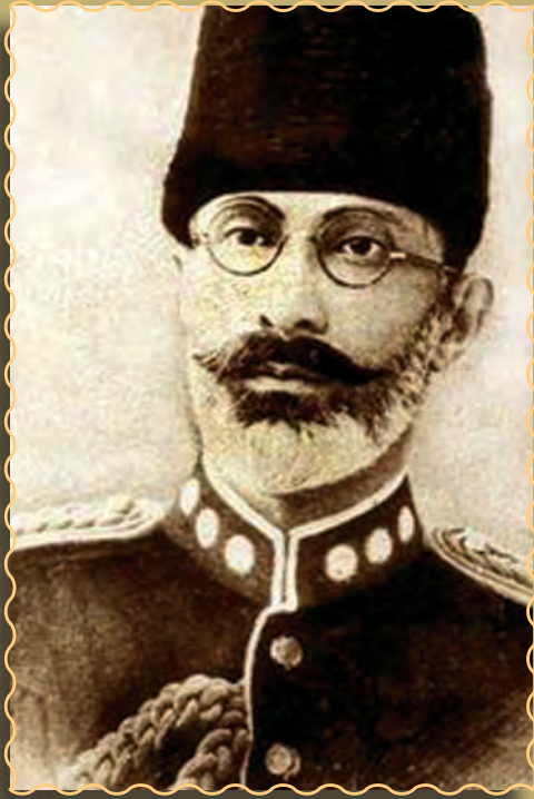
محمد نادر شاه

نادر شاه څرنگه واک ته ورسید. په کومو اصلاحاتو یې لاسی پورې کړ، شورشونه یې څرنگه غلی کړل. په دې لوست کې به ورسره آشنا شئ.