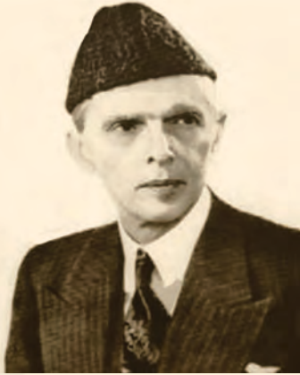
محمد علی جناح

کله چې د بودا دین مخ پر زوال شو، د هند سیال پاچاهان یو له بل سره په جگړې اخته شول. او دې کار مسلمانانو ته چې د اسلام د بیرغ ورونکي وو، مناسب فرصت په لاس ورکړ. د هند نیمه لویه وچه د مغلو پر وخت د مسلمانانو تر واکمنۍ لاندې متحده شوه، خو ډېرو هندو شاهانو د مسلمانانو د واکمنۍ پر وړاندې مخالفت وکړ او د هغوی پر وړاندې یې مبارزه پیل کړه. د غزنویانو، غوریانو اسلامي سلسلو د هند پر نیمې لویې وچې واکمنۍ وکړه او د سختو مخالفتونو سره سره دغه نوې اسلامي ټولنې د هندوانو د پخوانۍ ټولنې ترڅنګ کرار کرار ساه اخیسته. د نوموړې ټولنې پادشاهانو به خپل پوځیان هڅول چې له هندو بنځو سره ودونه وکړي. د هندوانو د ټیټې پورې ډېر کسان د اسلام د جاذبې او نیاو له امله مسلمانان شول.